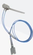
Neonatal Probe PB100