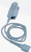
Adult Probe PA100